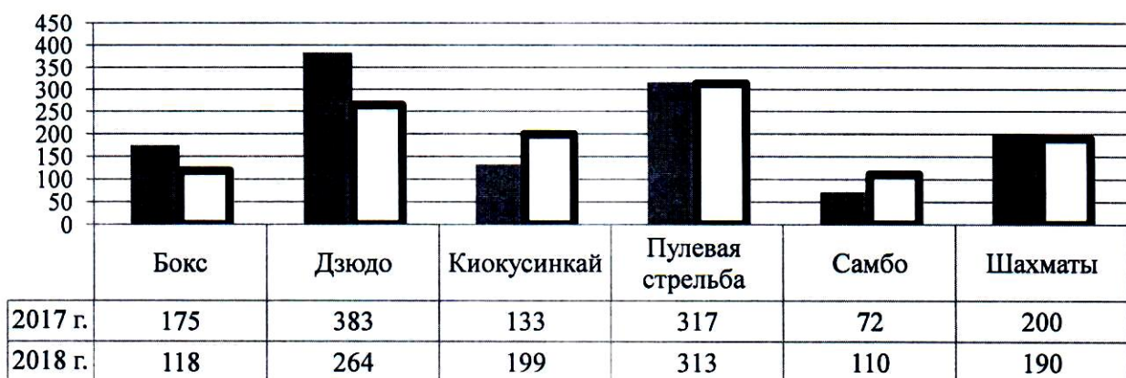
Динамика численности учащихся МАУ ДО ДЮСШ №5 в 2017, 2018 годах

Анализ статистических данных позволяет установить стабильное число учащихся, осваивающих общеразвивающие программы, некоторое снижение количества детей, занимающихся по предпрофессиональным программам и программе спортивной подготовки. Соотношение занимающихся по общеобразовательным (общеразвивающим и предпрофессиональным программам в области физической культуры и спорта) и программам спортивной подготовки представлено на гистограмме 2.