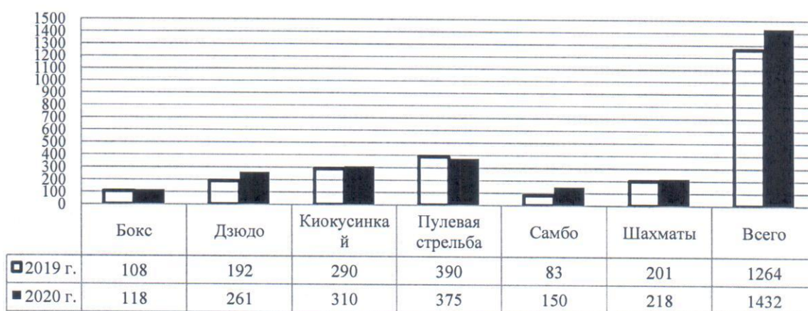
Гистограмма 1 Динамика численности учащихся МАУ ДО ДЮСШ № 5, 2019-2020 годы

Сравнительная динамика численности учащихся в 2019, 2020 гг. наглядно представлена на гистограмме 1.