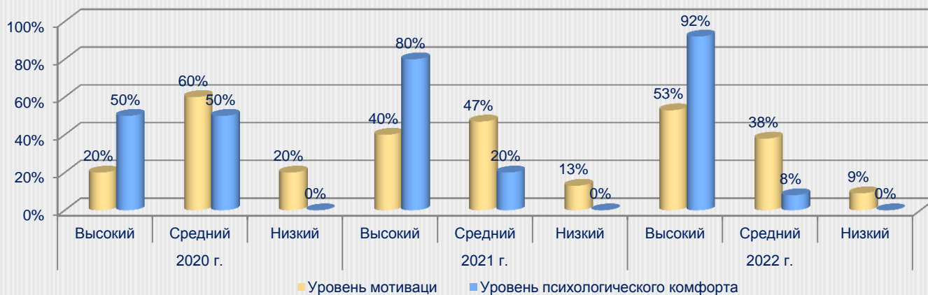
Динамика уровня личного роста учащихся

Изучение уровня мотивации и психологического комфорта учащихся позволяет сделать вывод о том, что тренеру-преподавателю удастся мотивировать детей к занятиям избранным видом спорта и создать благоприятную образовательную среду.