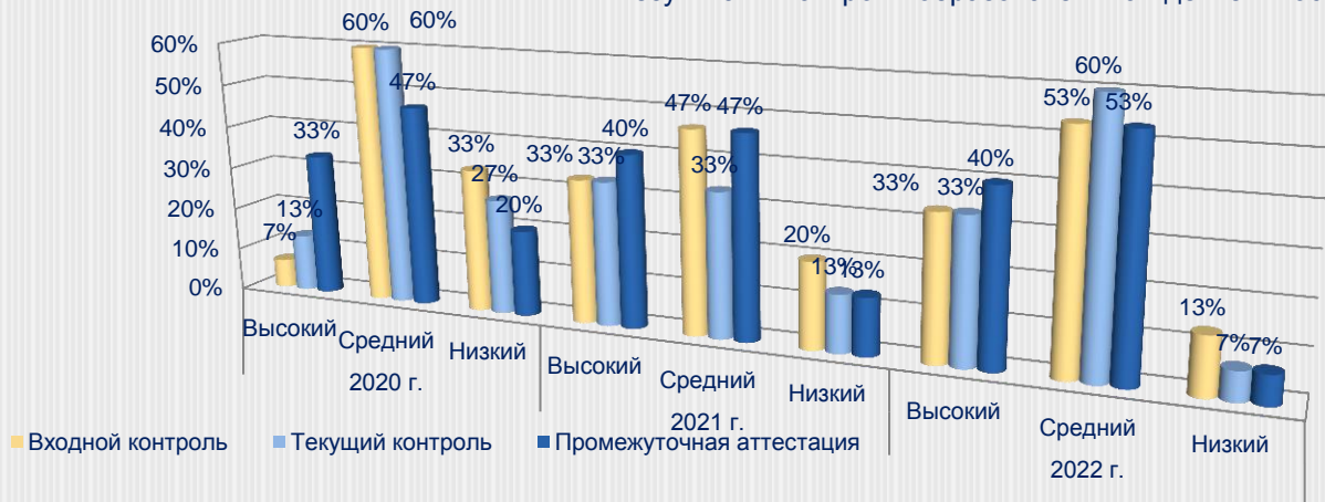
Результаты контроля образовательной деятельности

Показатели входного, текущего контроля и промежуточной аттестации по осваиваемым предметным областям в группах Э.Э. Муратовой выросли на 13,0%, что свидетельствует об эффективности избранных педагогом методов, форм, технологий организации образовательной деятельности