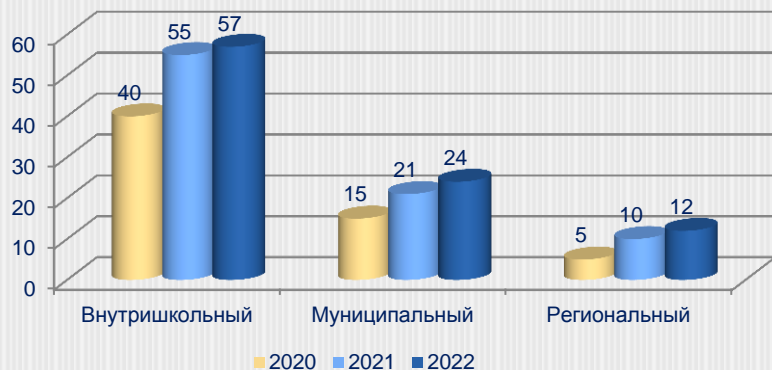
Динамика участия обучающихся в соревнованиях (чел.)